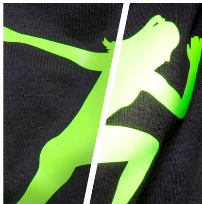
BF REF750A - REFLEKTIEREND LEUCHTGRÜN DIE FARBE LEUCHTGRÜN REFLEKTIERT GRÜN