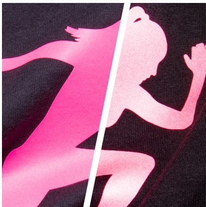
BF REF738A - REFLEKTIEREND LEUCHTROSA DIE FARBE LEUCHTROSA REFLEKTIERT ROSA