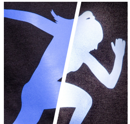
BF REF740A - REFLEKTIEREND ROYALBLAU DIE FARBE ROYALBLAU REFLEKTIERT BLAU