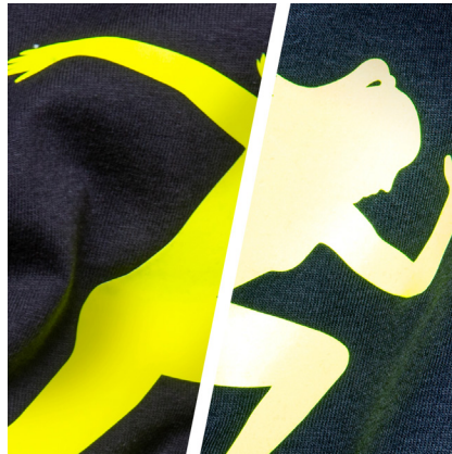
BF REF720A - REFLEKTIEREND LEUCHTGELB DIE FARBE LEUCHTGELB REFLEKTIERT GELB