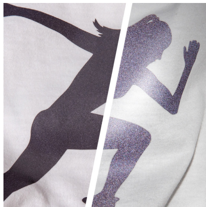
BF REF710A - REFLEKTIEREND SCHWARZ DIE FARBE SCHWARZ REFLEKTIERT SCHWARZ