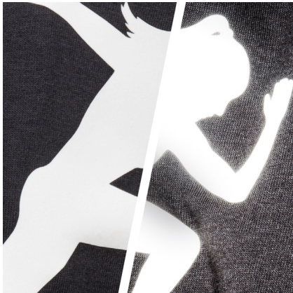
BF REF700A - REFLEKTIEREND WEISS DIE FARBE WEISS REFLEKTIERT OPTISCHES WEISS