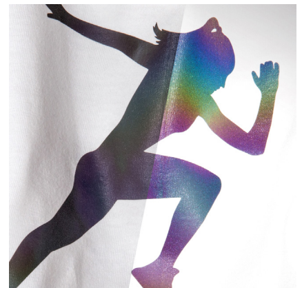
BF REF777A - REFLEKTIEREND REGENBOGENFARBEN DIE FARBE DUNKELGRAU REFLEKTIERT REGENBOGENFARBEN