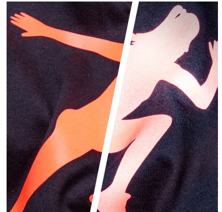
BF REF730A - REFLEKTIEREND LEUCHTROT DIE FARBE LEUCHTROT REFLEKTIERT ROT